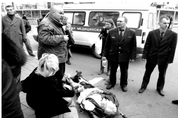
在爆炸中受伤的人员

明斯克消息：白俄罗斯首都明斯克11日傍晚发生的地铁爆炸事件中，死亡人数已升至11人，126人不同程度受伤，其中22人伤势严重。