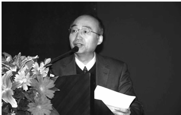
北京大学常务副校长吴志攀致辞

2011年3月2日上午，众多知名学者、政府官员和企业家们共计百余人齐聚北京大学国际关系学院秋林报告厅，参加北京大学世界新能源战略研究中心（CGNESS）成立大会。