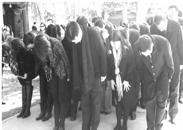
中国国民党青工总会参访团拜谒北京孙中山衣冠冢

中国台湾网3月25日北京消息：今天上午，来自台湾的中国国民党青工总会参访团集体前往位于北京西郊的香山碧云寺，拜谒孙中山先生衣冠冢。