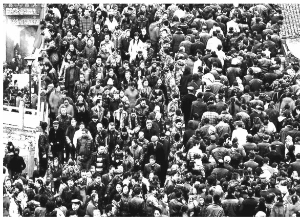
万人踩桥的热闹景象

3月24日，来自四川绵阳、德阳、成都等地的10万民众共赴绵阳安县，参加拥有200多年历史的民间活动“踩桥会”，以“踩桥”的方式为自己及家人祈福。据了解，绵阳安县“踩桥会”曾因“5.12”汶川特大地震中断了两年。